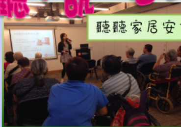
聽聽家居安全講座